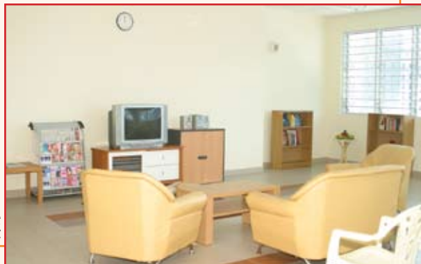
供会员看电视,听音乐和交友