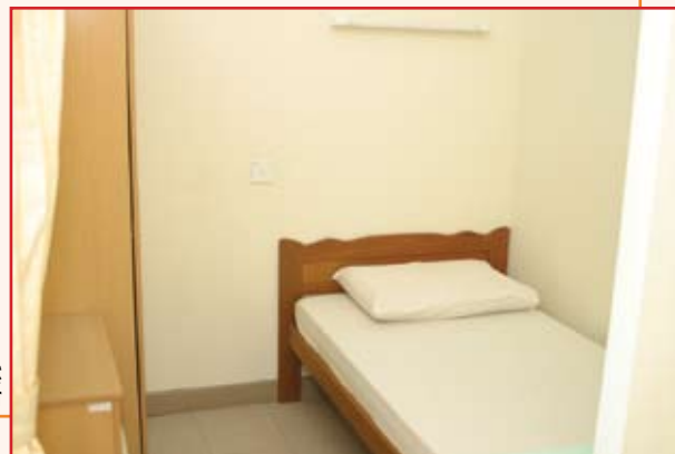
设有睡床,衣橱和五斗橱