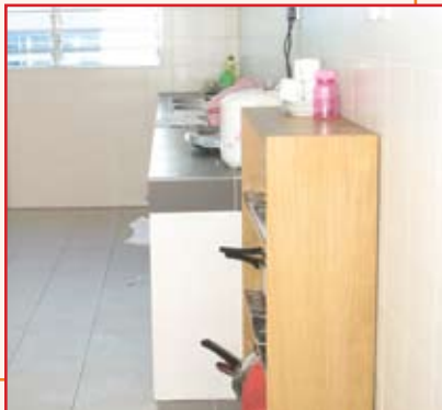
供会员从事简易烹饪